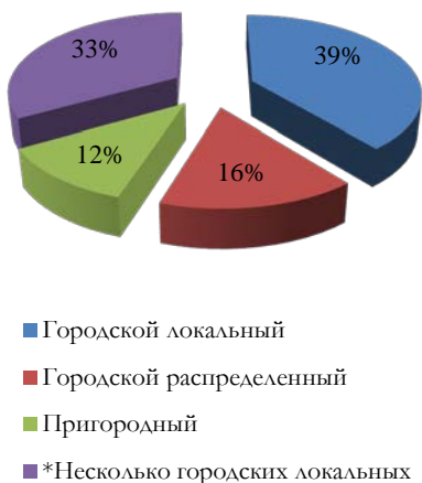
Рис. 3. Территориальная организация

Переходя непосредственно к организации кампусов университетов в выборке, следует отметить, что по количеству лидирует городской локальный тип (Рис. 3). Именно он присущ большинству стран с англо-саксонской системой. Прослеживая историзм формирования таких кампусов, мы заметим, что город появлялся непосредственно вокруг университета. То есть, как правило, в этом случае у университета была градообразующая функция. Таким образом, первые высокорейтинговые вузы создавались по системе «город-университет».