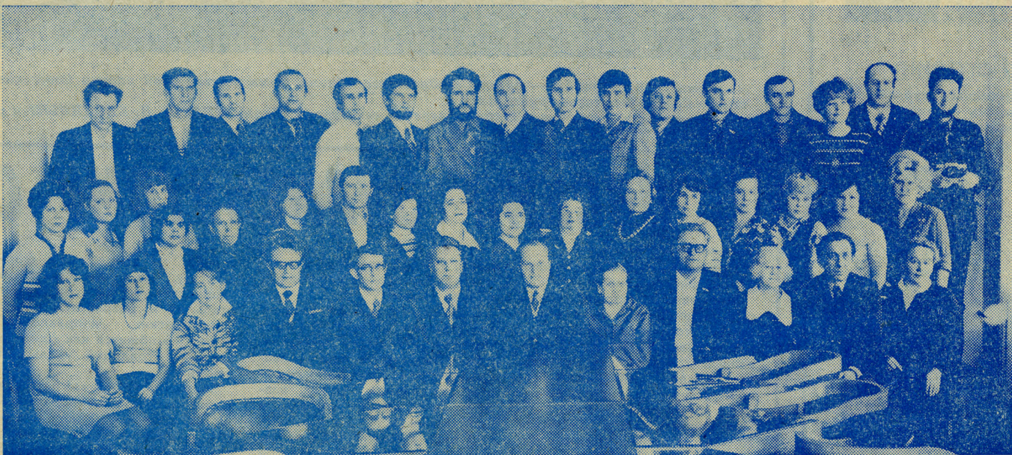
На снимке: наш дружный, наш славный, наш семидесятилетний коллектив.

Газета активно пропагандирует опыт передовых предприятий Среднего Урала по созданию богатых личесных счетов экономии и движению за повышение эффективности и качества работы каждого трудящегося, каждого коллектива, одобренные постановлениями ЦК КПСС, Совета Министров СССР, ВЦСПС и ЦК ВЛКСМ о Всесоюзном социалистическом соревновании в 1976 и 1977 годах.