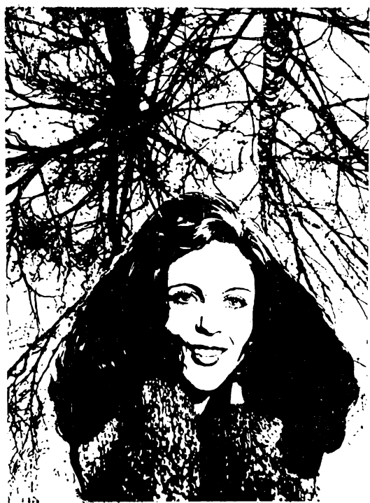
АПРЕЛЬ. Автор — художник М. Корякин.