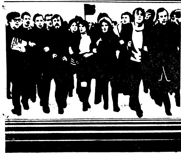
Плакаты художника М. Корякина.