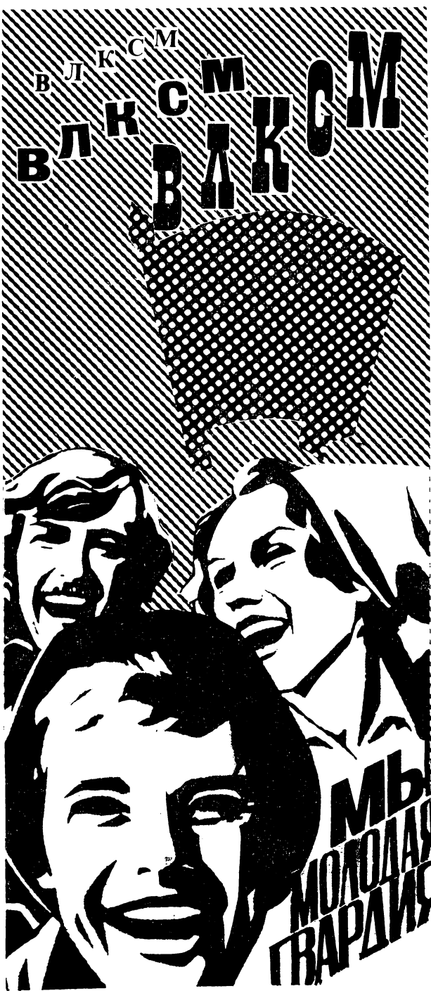
Плакат художника М. Корякина.

Избран новый состав партийного бюро, секретарем партийного бюро ИПК вновь избрана заведующая кафедрой научного коммунизма ИПК доцент Э. П. Овчинникова.