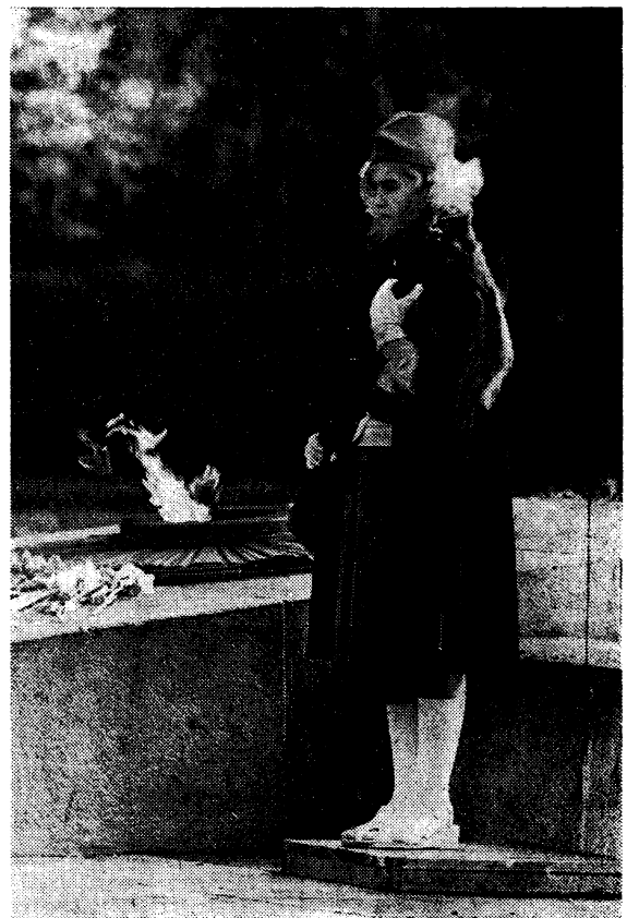
ПОСТ № 1.