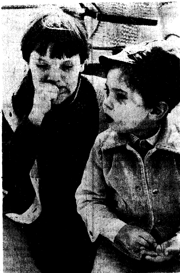
Сколько ж это будет!