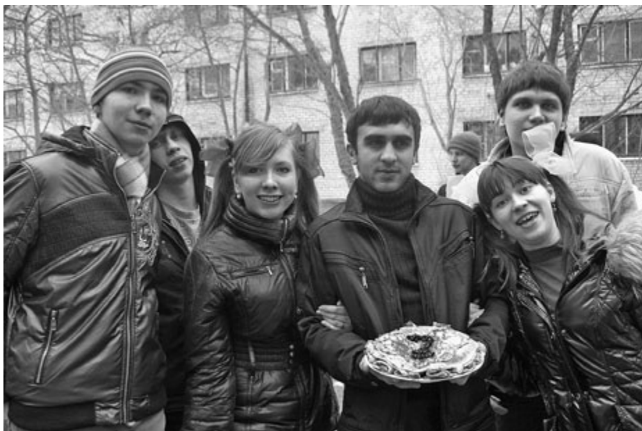
Масленица по-студенчески прошла 14 марта в студгородке УрГУ. Было весело. Подробности читайте на стр. 16.

Издается с 1934 г. • № 2 (2508) • 17 марта 2010 г. •