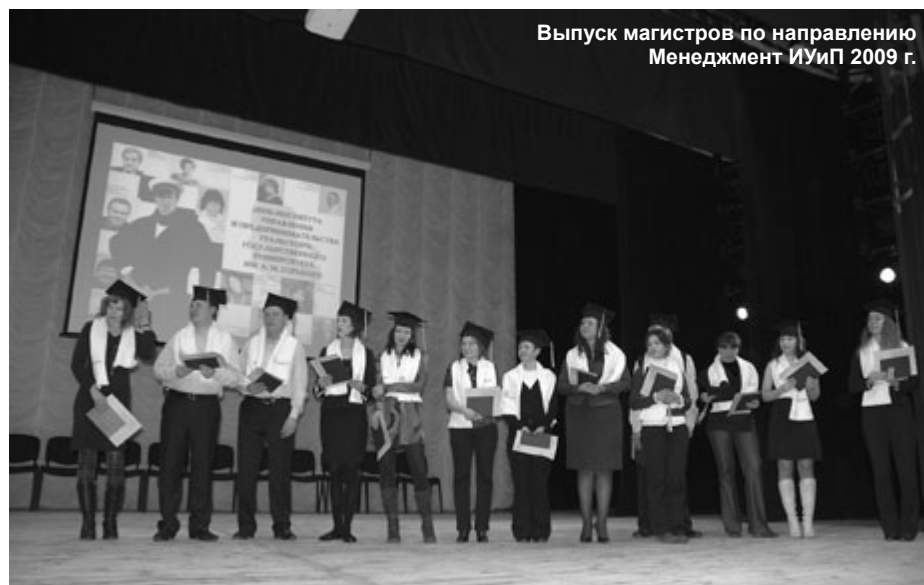
Выпуск магистров по направлению Менеджмент ИУиП 2009 г.

Постепенно наша система образования переходит на двухуровневую. Какие нюансы стоят за этим, студентам УрГУ, мы думаем, объяснять не надо: сегодня они сами кому угодно расскажут обо всех структурных и статусных тонкостях системы «бакалавр – магистр»! Да и сам переход был более чем плавным (почти 10 лет!), разговоров о нем велось на протяжении всего этого срока немало.