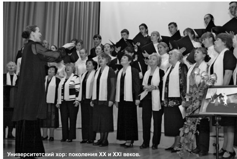
Университетский хор: поколения XX и XXI веков.

Хоровое пение, словно магнит, притягивает к себе...Завораживает и очаровывает гармонией голоса и мелодии. Но отнюдь не каждый хоровой коллектив способен пробудить в душе зрителей бурю эмоций, чувств, переживаний. В чем тайна музыкального волшебства?