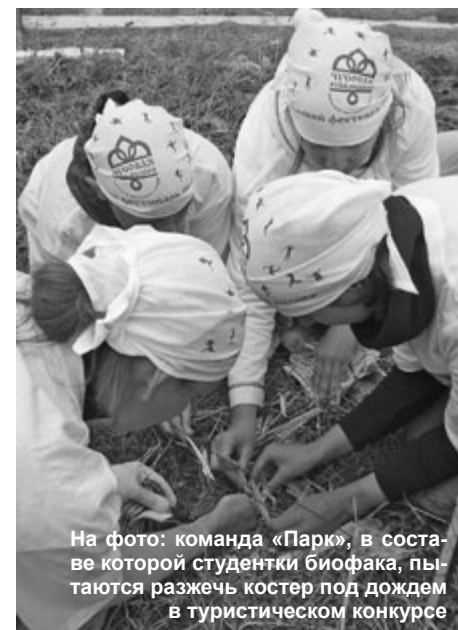
На фото: команда «Парк», в составе которой студентки биофака, пытаются разжечь костер под дождем в туристическом конкурсе

палубах, символизирующих те самые барки, которые сплавляли по Чусовой три века назад. Каждый желающий мог написать на барочке свое желание и верить, что оно обязательно сбудется.