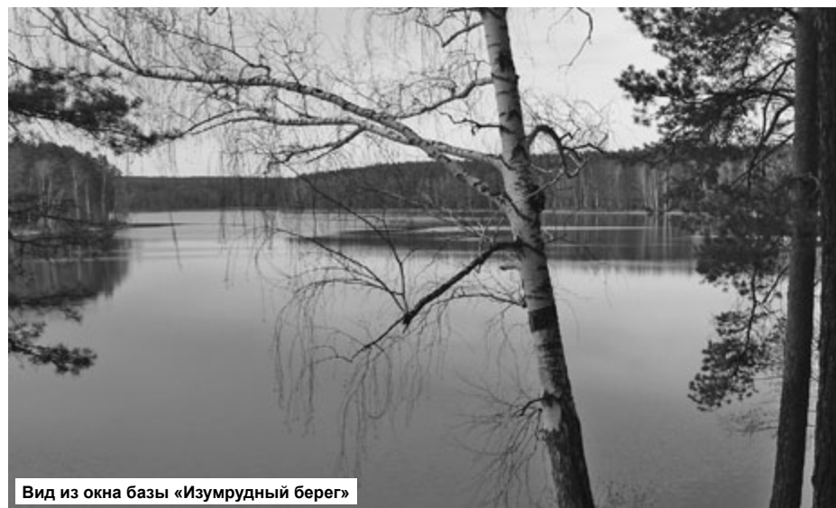
Вид из окна базы «Изумрудный берег»

Привет, первокурсник! Теперь ты с нами, а значит – свой. Поступить в УрГУ – почётно. Но ты и сам понимаешь: для того, чтобы с гордостью носить звание студента Уральского Государственного Университета им. А. М. Горького, одного поступления мало.