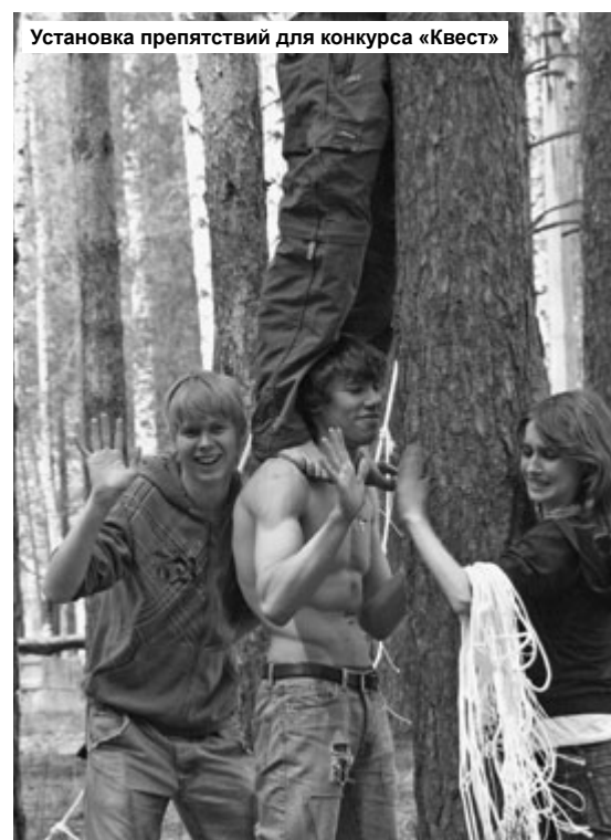
Установка препятствий для конкурса «Квест»

Ты должен максимально проявить здесь свои способности, раскрыться в полную силу, показать, на что ты способен. Понимаю, как трудно, быть может, это сделать сейчас, в самом начале. Но – не всё и сразу. Оглянись, сориентируйся, узнай людей, которые тебя окружают. В первую очередь – ты член небольшого сообщества, имя ему – академическая группа. Многие не придают этому большого значения. Напрасно. От того, какая подобралась группа, какие люди её составляют, какие внутри неё отношения, очень многое зависит. В том числе то, как пройдут для тебя годы студенчества – весело, интересно, задорно, в компании лучших друзей, или напряжённо, в атмосфере постоянных ссор и непонимания. А потому – карты тебе в руки и дружелюбие в глаза. Общайся, знакомься, дружи, будь заводилой в своей группе, участвуй, «креативь», стань активным!