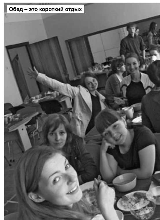
Обед – это короткий отдых

– Трудности были даже не столько физические, сколько моральные. Давление сильной конкуренции. На отборочном этапе ЛАГа участвовало много команд, и никто не конфликтовал, а здесь уже – финишная прямая. Ночной квест стал довольно трудным испытанием, и в физическом плане: мы не выспались, ночью было холодно. Ещё напряжённый график, очень маленькие перерывы между конкурсами, за опоздания незамедлительно начислялись штрафные баллы. То есть нужно было быстро переодеться, всё успеть, везде поучаствовать, довольно тяжёло выдержать ритм.