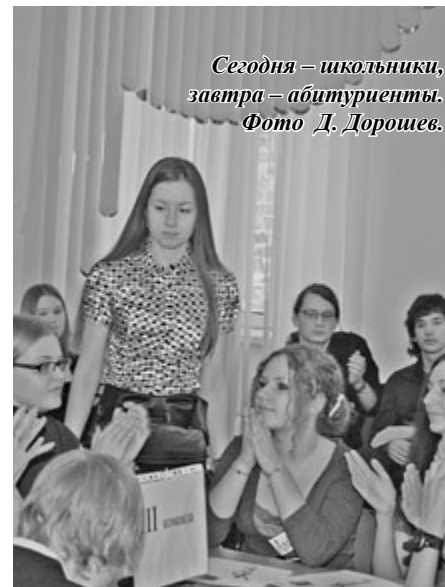
Сегодня – школьники, завтра – абитуриенты.

На развороте использованы материалы университетского сайта