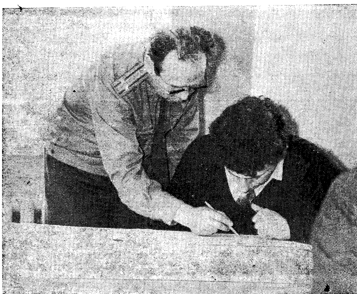
НА ЗАНЯТИЯХ ПО ВОЕННОЙ ПОДГОТОВКЕ.

Лучшее общежитие — победитель конкурса — награждается переходящим Красным знаменем университета и денежной премией 200 рублей. Жильцы комнат: за первое место — грамотой, денежной премией (50 рублей) и бесплатными путевками на местную турбазу; за второе место — грамотой и денежной премией (35 рублей); за третье место — грамотой и денежной премией (25 рублей).