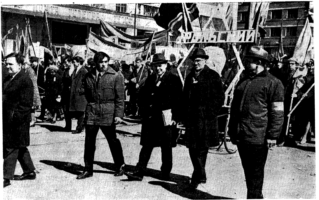
УРГУ НА ПЕРВОМАЙСКОЙ ДЕМОНСТРАЦИИ.