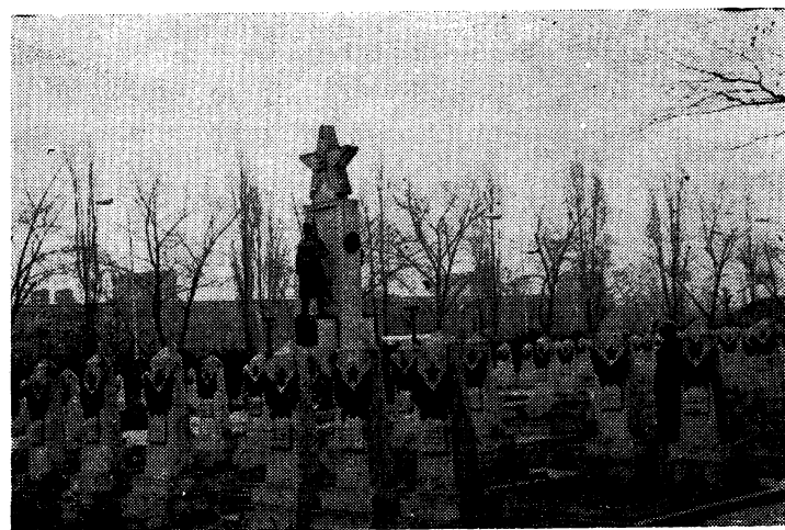
КЛАДБИЩЕ СОВЕТСКИХ ВОИНОВ В ПРАГЕ.