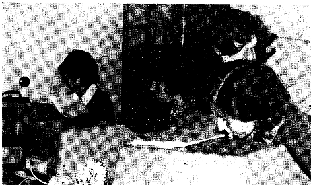
СТУДЕНТКИ ГРУППЫ МТ-305 НА ЗАНЯТИЯХ В ЛАБОРАТОРИИ МАЛЫХ ЭВМ.