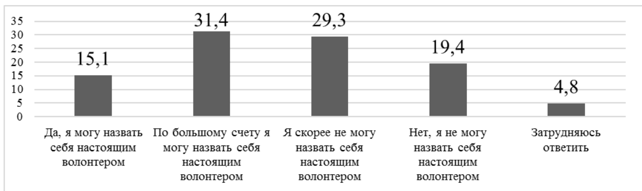
Рис. 1. Респонденты о самоидентификации в качестве волонтера (в % от ответивших)

2. Проблема идентификации с общностью. Более 50 % респондентов не идентифицировали себя в качестве настоящего волонтера (склонились к отрицательному ответу или затруднились ответить, рисунок 1), что говорит о недостаточной сплоченности, устойчивости общности волонтеров.