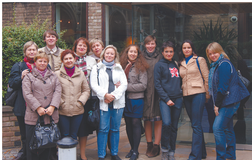
Кембридж — преподаватели английского языка УрФУ на стажировке в Кембриджском университете, сентябрь 2012.

— Очевидно, что в условиях глобализации английский становится языком мирового общения. Это важно и для трудоустройства, потому что наш рынок труда не существует в отрыве от мирового. Уровень владения языком влияет на возможность участия в академической мобильности. Наши студенты не должны проигрывать своим зарубежным коллегам не только по уровню знаний, но и по уровню возможности презентации своих знаний на английском языке.