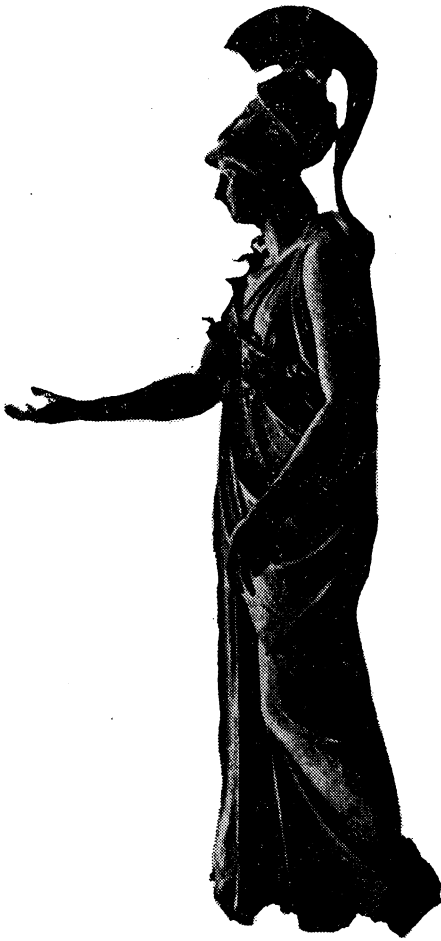
Рис. 3. Статуя Афины из Пирея.

два небольших углубления). По аналогии с другими изображениями Афины и ее атрибутами можно предполагать, что в правой руке богини была сова или Ника.