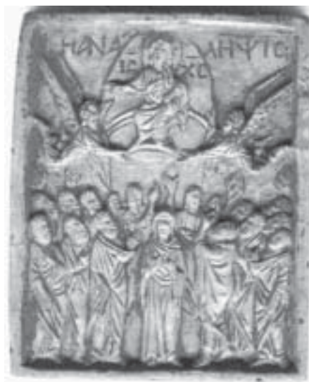
3. Стеатитовая иконка со сценой Вознесения XII — начало XIII в.

Однако прежде о датировке. И. Калаврису-Максейнер отнесла хранящуюся в Государственном историческом музее иконку к XIV в. В качестве аналогии можно упомянуть одну из пластинок с изображением сцены Вознесения. Она происходит из Ватопедского монастыря и считается изделием начала XIV в. На ней, в нижнем регистре, в центре изображена Матерь Божья с воздетыми руками и двумя стоящими рядом с ней апостолами [Банк, 1978, рис. 95]. Следует