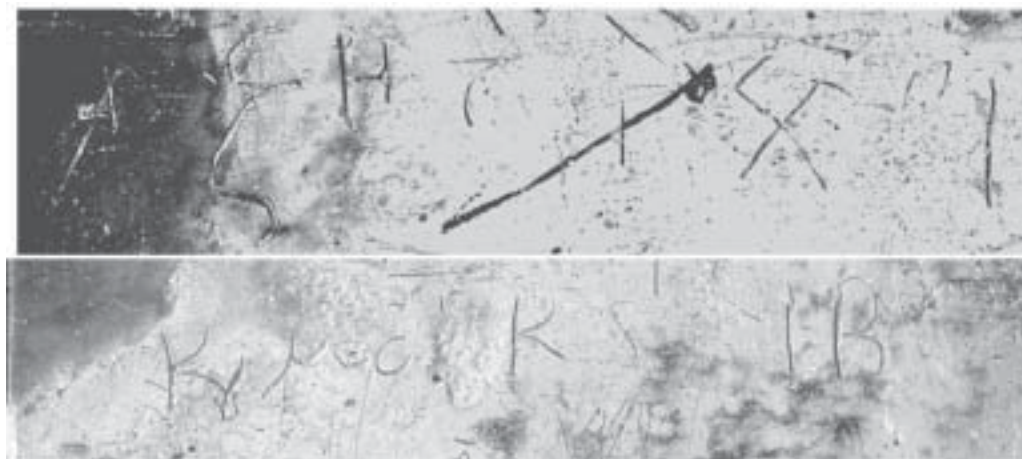
4. Обратная сторона иконы со сценой Вознесения. Граффити

Форма букв и манера написания текста палеографически существенно отличаются от надписи на лицевой стороне, где непосредственно под рамкой выгравировано: Н 'ΑΝΑΝΑΛΗΨΙΣ и в мандорле с обеих сторон от сидящей фигуры Иисуса Христа монограмма "ΙC ΧC". Московская исследовательница А. А. Евдокимова восстанавливает граффити следующим образом: ΑΞΗΤΟΝ-ΛΕΓΟΝΕΧΕΙΣΤΩ ΚΟΥΜΕΙΚ ΣΞΙΒ, полагая, что здесь было написано следующее: αζητον λεγων εχει τω Κουμεικ σξιβ, предлагая такой вариант прочтения текста: «Почитаемое говорящий взял [приобрел] 4 у Кумейка 6712 год» (1203—