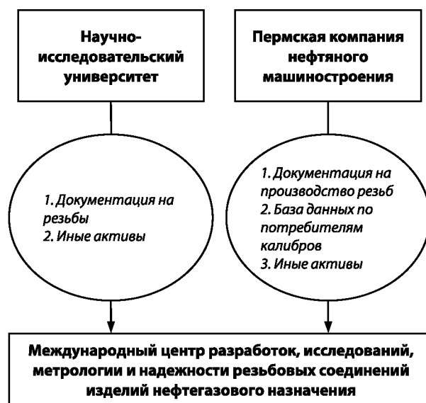
Рис. 2. Принципиальная организационная схема создания МЦРС

Из представленной на рис. 2 принципиальной организационной схемы создания МЦРС видно, что реализация проекта предполагает два этапа. На первом этапе создается лаборатория резьбовых соединений в структуре НИУ-ПГТУ, которая является базой для проведения работ в рамках центра. Далее на основе объединения специалистов ПКНМ и НИУ осуществляется комплекс мероприятий по развитию МЦРС. По предварительной оценке окупаемость проекта после завершения сертификации центра при 25%-ной рентабельности работ составит не более 4–5 лет. При этом жизненный цикл проекта представляется достаточно длинным, даже исходя из ограниченного перечня рассмотренных выше поставленных перед центром задач.