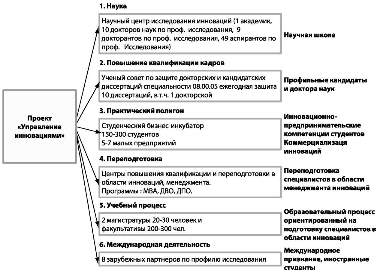
Рис. 4. Структура и направления проекта «Управление инновациями»

— методология и технология саморазвивающихся инновационных систем (инновация как внутренняя необходимость; социальное предпринимательство: слияние личного и бизнеса; технологическое брокерство, социальные сети, живые корпорации; цепочки создания инновационной ценности; организационно-поведенческие механизмы разделения труда в интеллектуальной сфере; саморазвивающиеся организации);